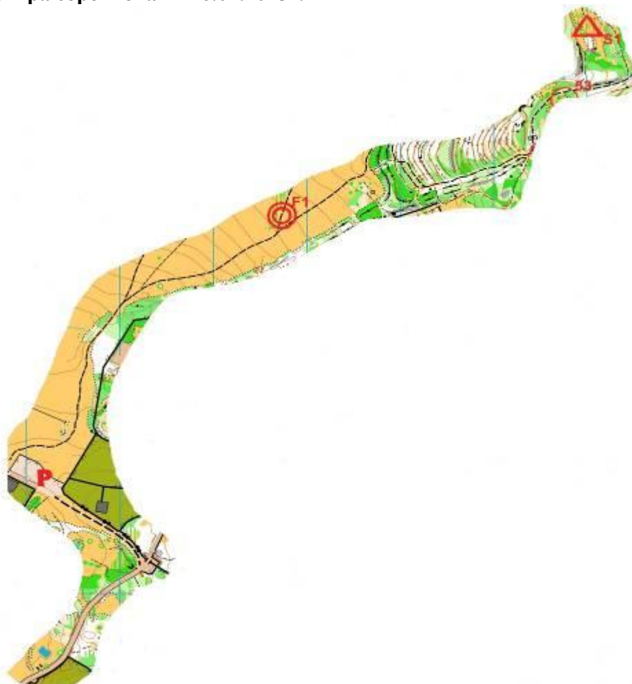
Схема центра соревнований 6.07.2015г.