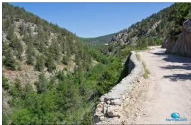
Дорога с.Родниковое – с.Колхозное (к ДОЛ «Горный»)

минут. Зона считки результатов между финишем и парковкой. Карта М-1:4000, сечение рельефа 5м. Картограф: Бортник В. Издание 2013г.