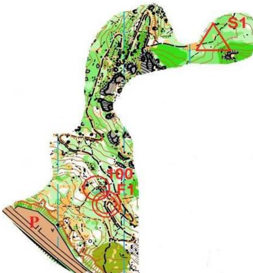
Схема центра соревнований 7.07.2015г.