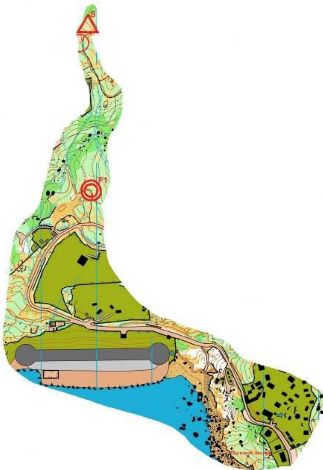
Схема центра соревнований 8.07.2015г.